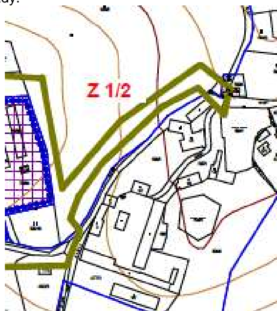
obr. 2 – výřez z upraveného návrhu pro veřejné jednání

Paní Hiršlová v této souvislosti uplatnila písemnou připomínku dne 01.12.2017, kdy vyslovila nesouhlas s navrženým řešením jako vlastnice pozemku p.č. 505/5 a dne 28.12.2017 doplnila svou připomínku o návrh řešení této dopravní situace jižním směrem kolem zámecké zahrady.