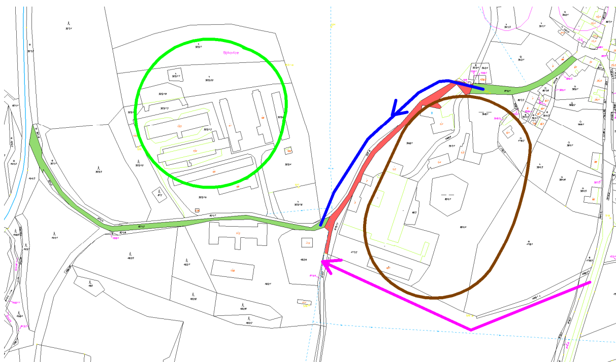
obr. 3 – situace v území: hnědá-areál zámku, zelená-areál Býkovice, který má být přestavěn, zelená-místní komunikace, červená-sporný úsek komunikace, modrá-původní návrh přeložky, fialová-návrh přeložky paní Hiršlové

budoucná se neočekává, že k vymezení nových ploch dojde. Všechny pozemky jsou ve vlastnictví paní Hiršlové a zemědělsky obhospodařované. V tomto smyslu byl návrh upraven a předložen k veřejnému projednání.